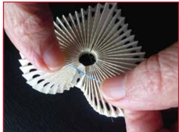
6. Ziehen Sie den Faden an und sichern Sie ihn mit einem doppelten Knoten.