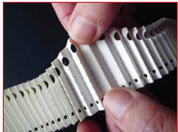
4. Gut andrücken und wieder falten.