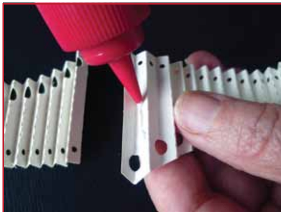
3. Kleben Sie die äußeren Bergfalten der beiden Teile aufeinander.