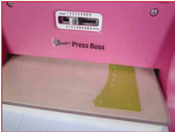
1. Stanzen Sie die Folding Die mit der Stanzmaschine.