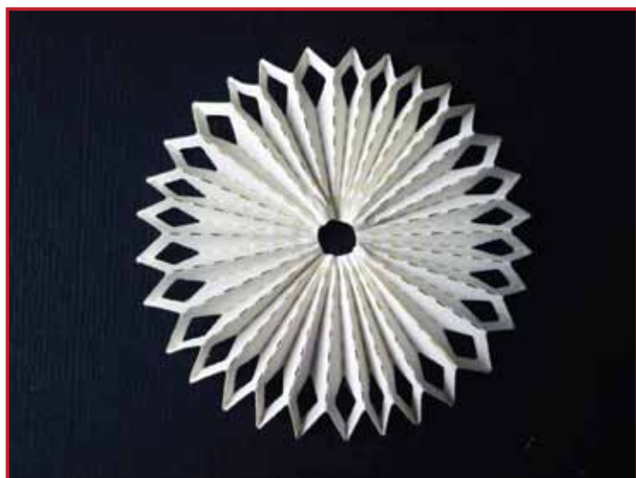
6. Und so sieht es dann aus!