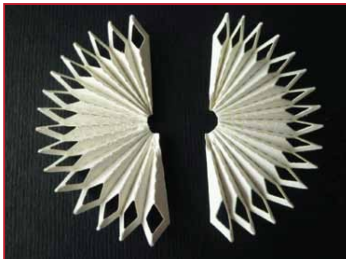
3. Falten Sie diese an den Falzlinien wie eine Ziehharmonika.