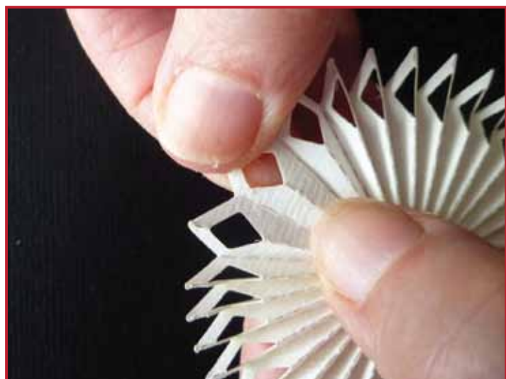
5. Gut andrücken und wieder falten.