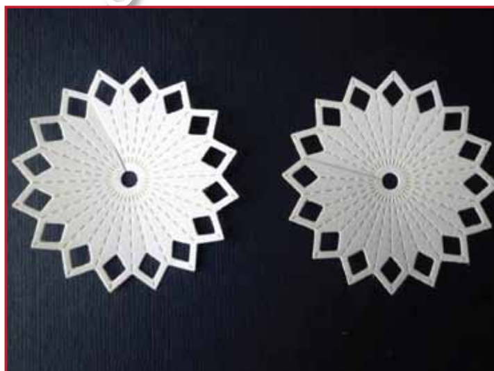
2. Fertigen Sie zwei Stanzteile.