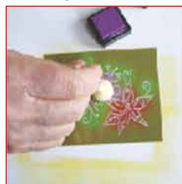
6. Geben Sie den kleineren Blumen eine andere Farbe.