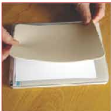
10. Legen Sie die Embossingmatte darauf.