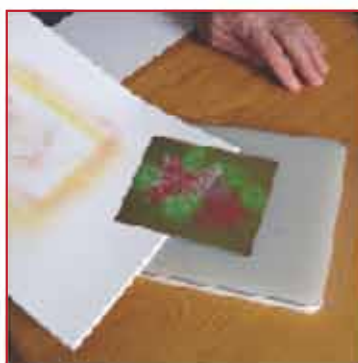
8. Schieben Sie die Schablone auf die Platte der Stanzmaschine (nicht berühren!)