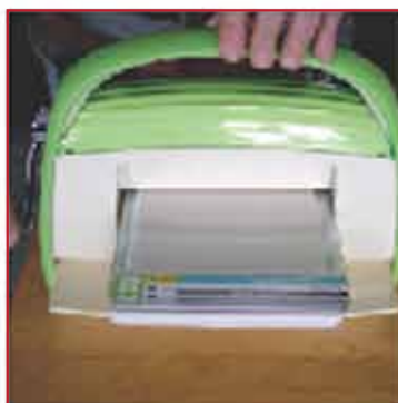
12. Legen Sie die obere Platte darauf und drehen Sie dies durch die Stanzmaschine.