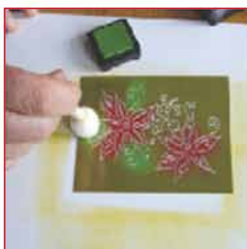
5. Färben Sie die Blätter grün.