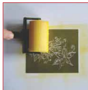
3. Inken Sie damit die komplette Schablone. Dies ist die Hintergrundfarbe.