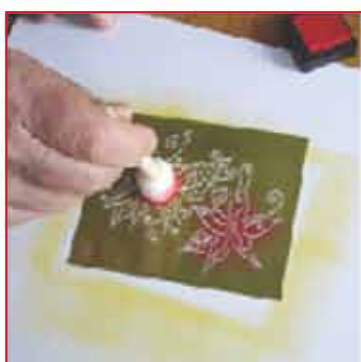
4. Färben Sie die Blumen mit einem Schwammpinsel rot.