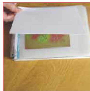
9. Legen Sie den Karton mit der guten Seite nach unten darauf.