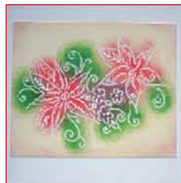
12. Und so sieht es dann aus!