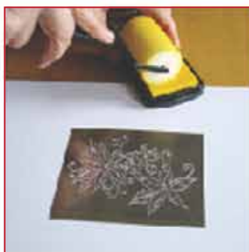
2. Inken Sie den Farbroller.