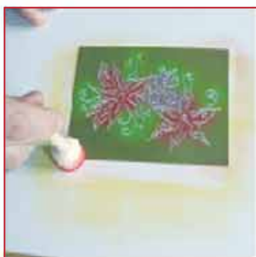
7. Inken Sie leicht die Kanten und Ecken.