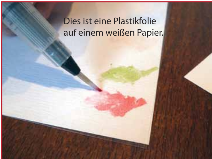
3. Tragen Sie etwas Memento Farbe auf eine Plastikfolie auf, nehmen Sie diese mit dem Wassertankpinsel auf.