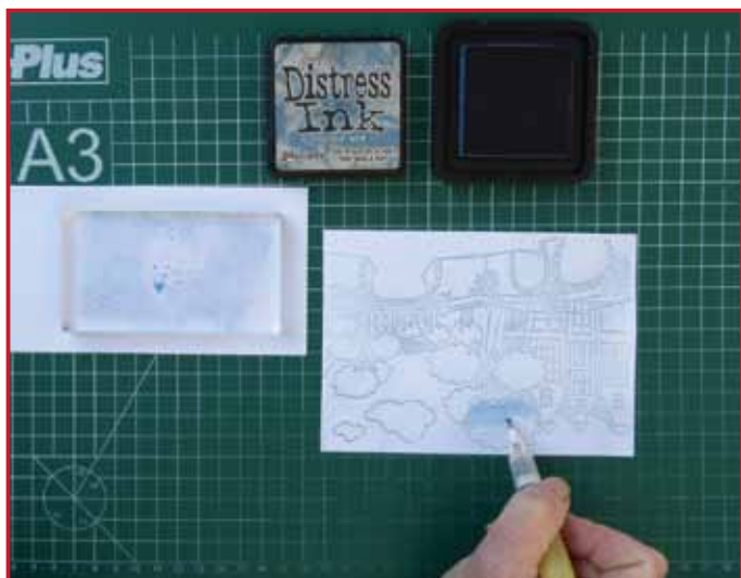
5. Nehmen Sie etwas dunklere Farbe mit Ihre Wasserstift auf und füllen Sie die Flächen mit drehenden Bewegungen von links nach rechts