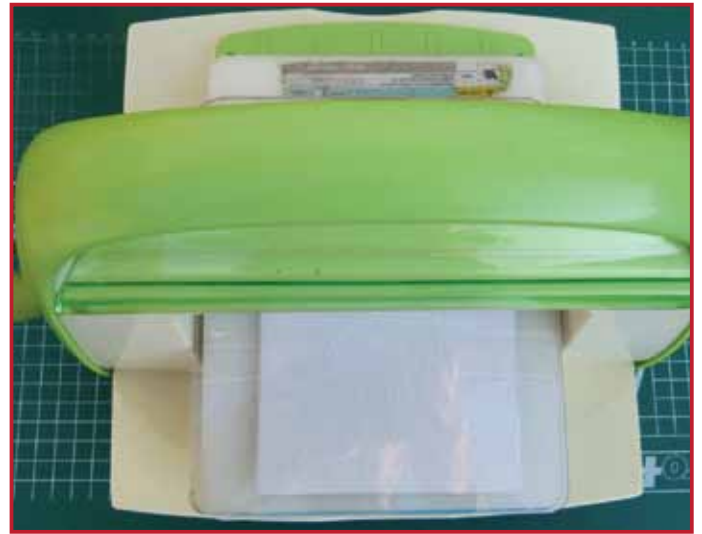
2. Prägen Sie die weiße Karte mit Hilfe des Picture Embossing Folders.