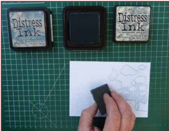
3. Inken Sie die Karte komplett mit der hellsten Farbe und einem Schwamm.