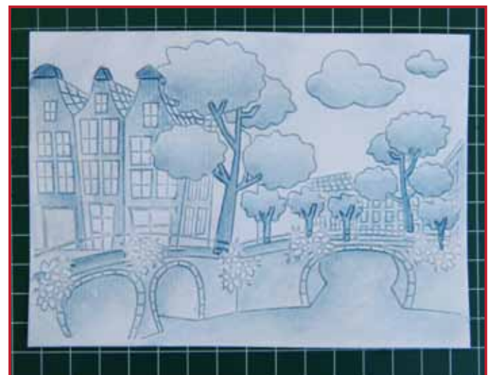
6. Und so sieht es dann aus.